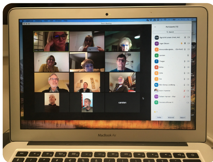
Den fremherskende mødeform anno 2021.